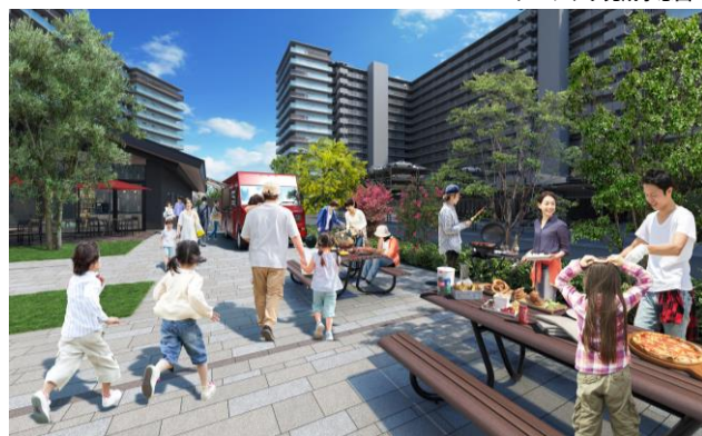
バーベキュースペース完成予想図