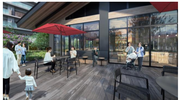
センターハウス完成予想図

布団やシーツ類など大型の洗濯物や一度に大量に洗濯したい時に便利な大型ランドリーを4台設置。24時間ご利用が可能です。