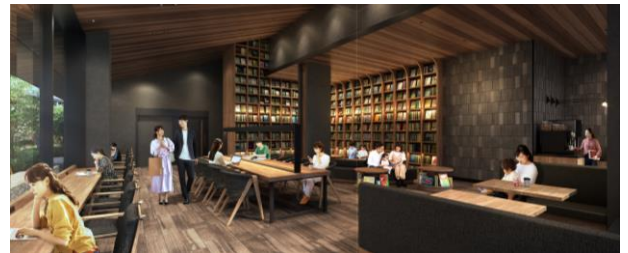
カフェラウンジ・ライブラリーラウンジ完成予想図