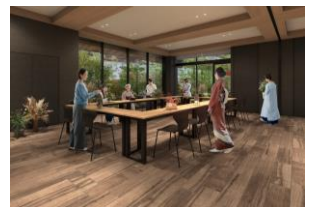
カルチャールーム完成予想図