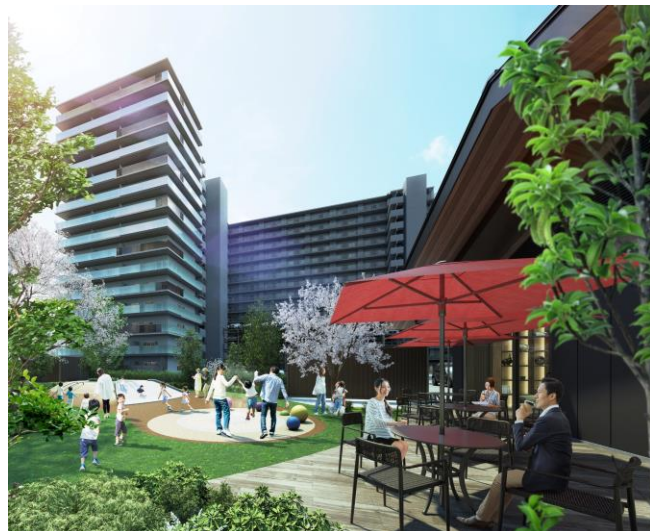
プレイグラウンド完成予想図

冒険心を刺激する手すりパイプやクライミングホールドなどを設け、足元は安心なゴムチップ素材を使ったマウントとするなど、安全に配慮しながら自由に遊べる空間を実現しました。