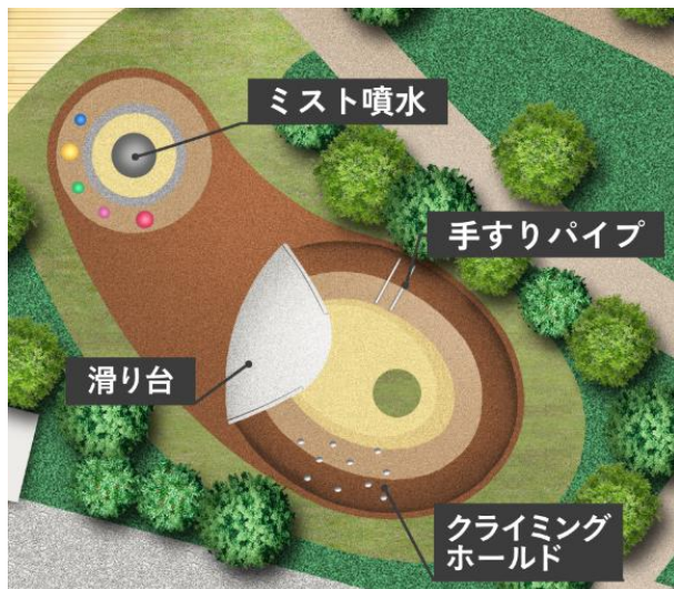
プレイグラウンド概念図