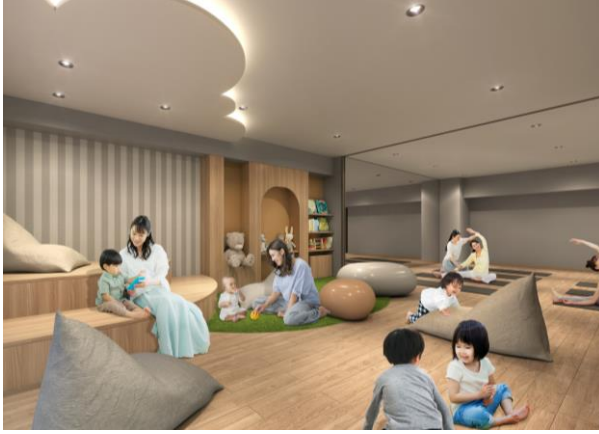
キッズベース完成予想図

また、多目的に使えるマルチスタジオの壁面は鏡張りとなっており、ヨガやダンス等のレッスンにも最適です。